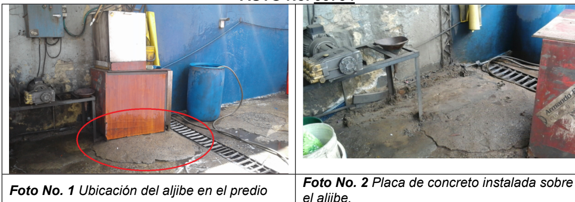
Foto No. 1 Ubicación del aljibe en el predio